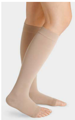
AD · Mandel Fußspitze offen