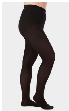
AT · Pfeffer Fußspitze geschlossen