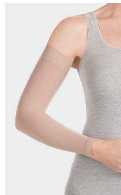
CG · Mandel Gestrickabschluss