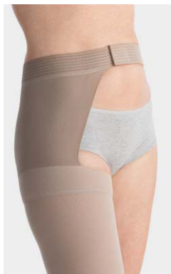
AG · Mandel Hüftbefestigung