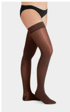
AG · Kakao Spitzenhafrand