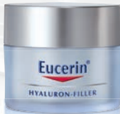
HYALURON-FILLER Tagespflege für trockene Haut