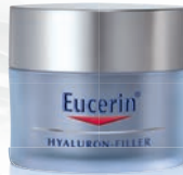
HYALURON-FILLER Nachtpflege für alle Hauttypen