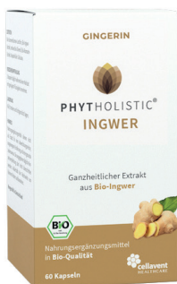
PHYTHOLISTIC® INGWER aus Bio-Ingwer Ganzheitlicher Ingwer-Extrakt PZN 13853336

Unter www.phytholistic.com finden Sie ausführliche Informationen zu den Phytholistic® Produkten. Gerne sind wir auch persönlich für Sie unter +49 (0)211 78 17 69 80 erreichbar oder Sie schreiben uns eine E-Mail an info@cellavent.de