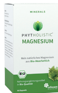
PHYTHOLISTIC® MAGNESIUM aus Bio-Meerlattich Trägt zum Erhalt von Knochen und Zähnen bei PZN 14178730