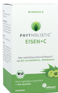
PHYTHOLISTIC® EISEN+C aus Bio-Curryblättern, Bio-Amlabeeren Unterstützt den Energiestoffwechsel PZN 14017398