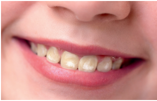
Beispiel einer Zahnfluorose mittlerer Ausprägung

Bei Fluorosen handelt es sich um creidig-weiße Schmelzflecken auf den bleibenden Schneide-Zähnen . Hervorgerufen werden sie durch eine Störung der Mineralisation während der Zahnreifung. Ursache ist eine zu hohe Fluoridaufnahme in der Phase der Zahnreifung. Als besonders sensibel gilt die Phase um das zweite und dritte bis hin zum fünften Lebensjahr.