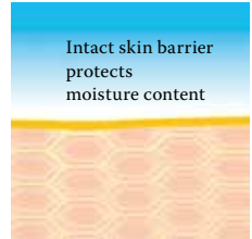
Intact protective skin barrier with lipids rich in linoleic acids.

Visit us at www.linola.com and select the drop-down menu "country". Here you will find all the latest information on Linola Lotion, Linola Face, Linola Hand and Linola Foot Lotion as well as other Linola products for a wide range of skin problems.