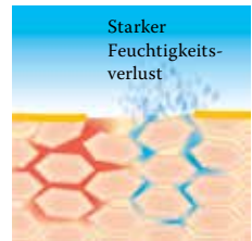
Lipidverlust führt zu einer gestörten Hautbarriere: Die Haut verliert viel Wasser und trocknet aus.